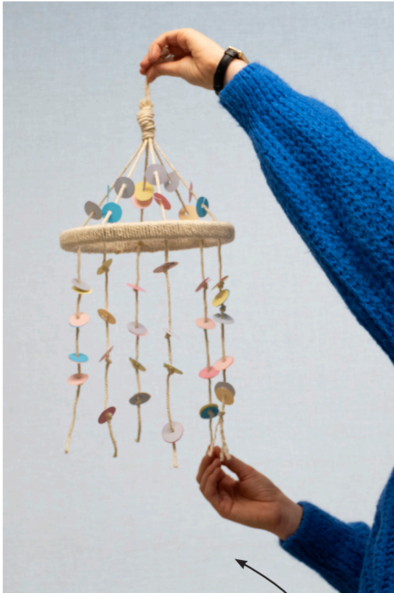
Ta future création